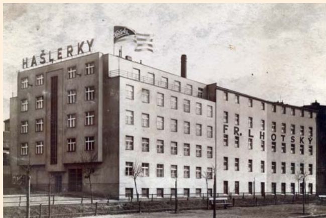
Levá část budovy je z r. 1936, pravá část z r. 1922