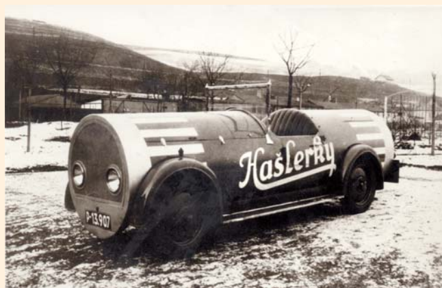
Dodávkový vůz jako pojízdná reklama