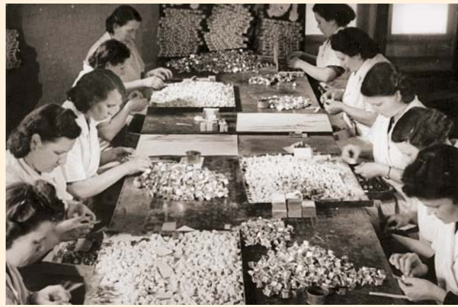
Ruční balení některých druhů bonbónů