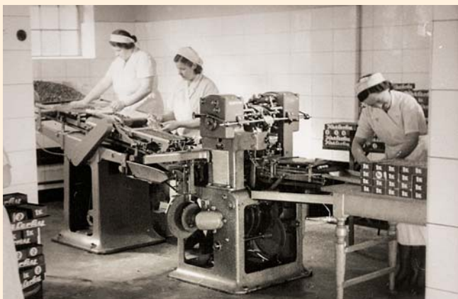
Strojové balení ruliček Hašlerek